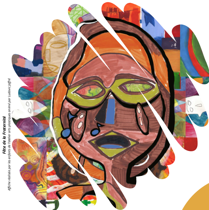
Fête de la Fraternité Affiche réalisée par les enfants de l'atelier arts plastiques animé par Ludovic Joffre

Du lundi au vendredi : 9h00 à 12h00 / 16h30 à 18h30 Jeudi 9h00 à 12h00 / 14h00 à 18h30